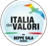
ITALIA dei VALORI per BEPPE SALA sindaco