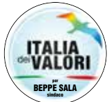
ITALIA dei VALORI per BEPPE SALA sindaco