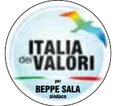
ITALIA dei VALORI per BEPPE SALA sindaco