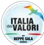
ITALIA dei VALORI per BEPPE SALA sindaco