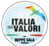
ITALIA dei VALORI per BEPPE SALA sindaco